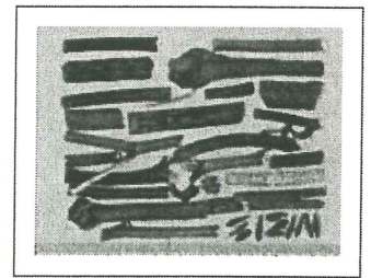
市售地上部藥材特徵圖